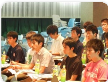
真剣に学ぶ選手達