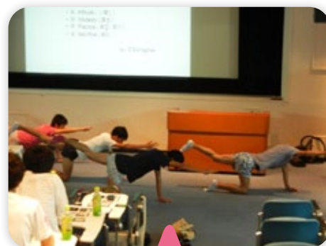
選手の筋力チェック