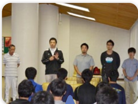
先生方による塩原研修所で実施された選手のメディカルチェック