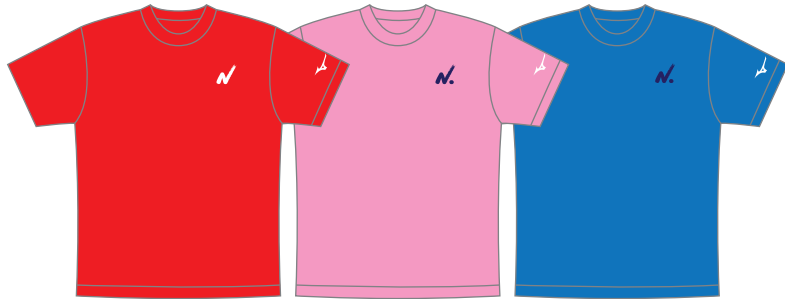
レッド ピンク ターコイズ