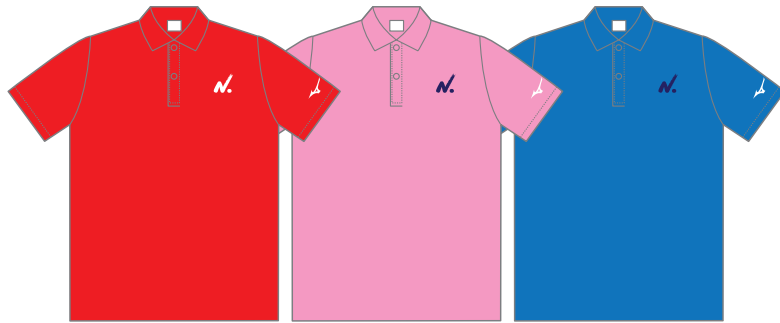
レッド ピンク ターコイズ